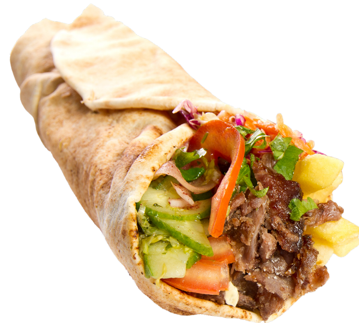
Figure 1. A figure caption.

Some block contents, followed by a diagram of shawarma, followed by a dummy paragraph.